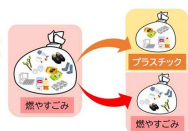
▲分別方法(イメージ)