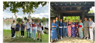
▲ウィーン市ドナウシュタット区高校生相互派遣事業 ▲